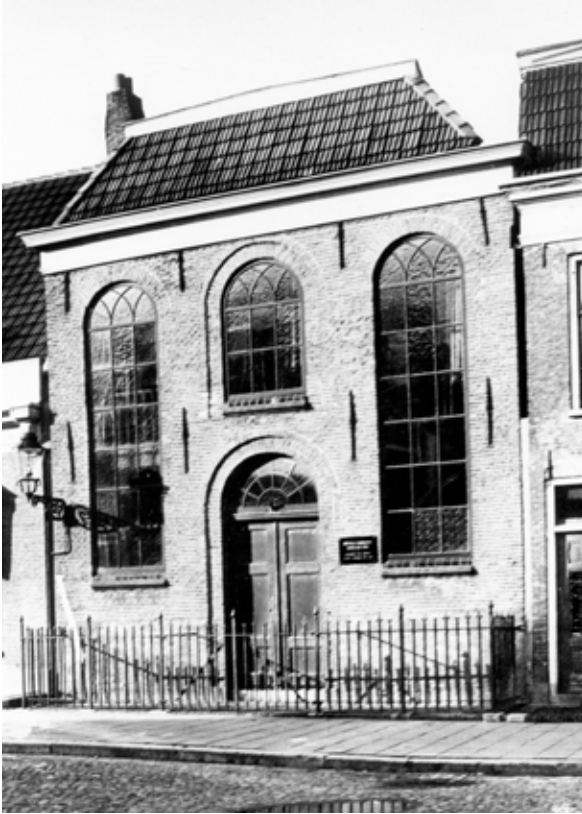
De Hersteld Evangelisch Lutherse kerk in Harlingen