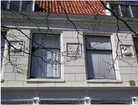
Het pand Heiligeweg nr. 9 met de lutherse zwanen.

1646. Omstreeks 1660 is er sprake van een zelfstandige lutherse gemeente.