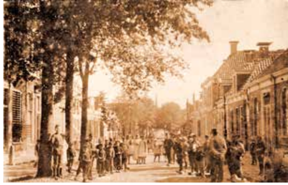
Lutherse kerk te Workum (uiterst rechts)

Reeds in 1718 wordt melding gemaakt van lutheranen in Workum. Regelmatig bezochten de lutherse voorgangers uit Harlingen hun geloofsgenoten in Workum. Bekend is dat de Workumers in het begin van de 19 e eeuw met Pasen naar Harlingen gingen om daar het Avondmaal te vieren. In 1800 woonden er in Workum 33 lutherse lidmaten, rond 1820 waren er nog 5, maar in 1841 was het aantal weer gestegen tot 41. Daarmee ontstond er behoefte aan een eigen gemeente. Met steun van de Evangelisch-Lutherse Synode werd een gebouwtje aan het Noard gekocht van “Het Nut” en ingericht als kerk.