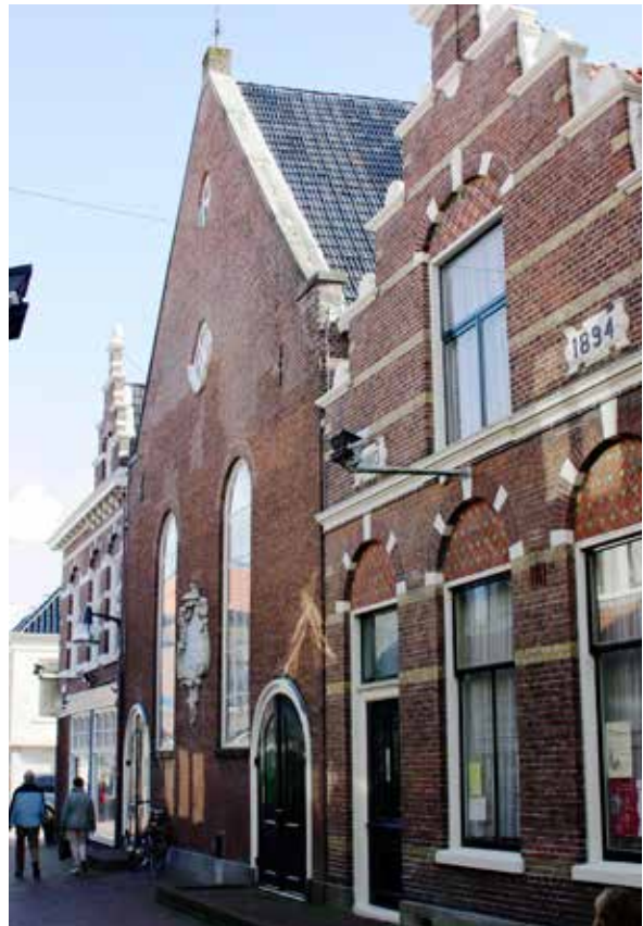
Huidige aanblik kerkgebouw en kosterij te Leeuwarden.

Anno 2017 zijn de lutherse kerk in Leeuwarden en naastliggende kosterij nog volop in gebruik. Iedere zondag is er een lutherse dienst. De kerk wordt frequent verhuurd voor muzikale en culturele evenementen.