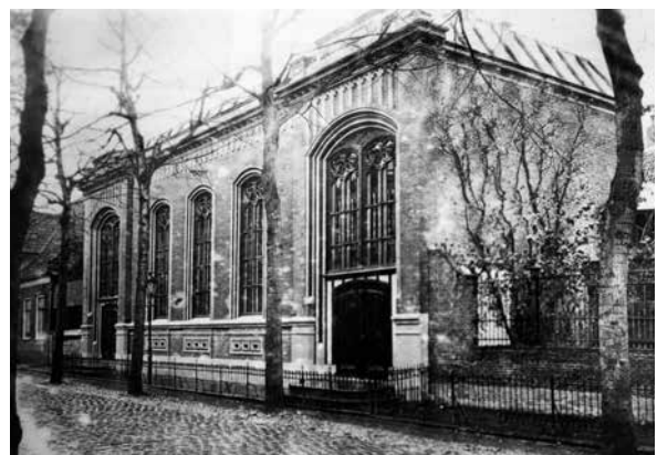
De kerk van 1879

ruim 200 Hervormden. Oorzaak daarvan was een plotse koerswijziging binnen de Hervormde kerk: na een jarenlange vrijzinnige traditie werden in dat jaar twee orthodox denkende predikanten benoemd. Met 240 lidmaten bleek de lutherse kerk te klein. Daarom werd in 1878 besloten de bestaande kerk en pastorie te slopen en daarvoor in de plaats een grotere kerk te bouwen. Men schatte dat daarvoor f 25.000,- nodig zou zijn, waarvoor de kerkenraad, daartoe gemachtigd door de Lutherse Synode, een lening mocht afsluiten. De aanbestedingssom bleek uiteindelijk f 11.175,-. De kerk werd gebouwd door aannemer Schiere te Boornbergum onder architectuur van de gebroeders J. en S. Posthuma. Het bestek vermeldt als afmetingen van de kerk 19,80 bij 8,70 m. Het dak was van zink. Er kwamen twee ingangen: één voor de kerkgangers aan de noordzijde en één voor dominee en kerkenraad aan de zuidzijde. In de kerk werd een rondgaande kraak geconstrueerd. Het gebouw is in neo-gotische stijl opgetrokken, een variant op de Engelse "perpendicular style." Er is bijzonder snel gewerkt: in januari 1879 werd het werk aanbesteed, in april begon men en reeds in oktober van dat jaar werd de nieuwe kerk ingewijd!