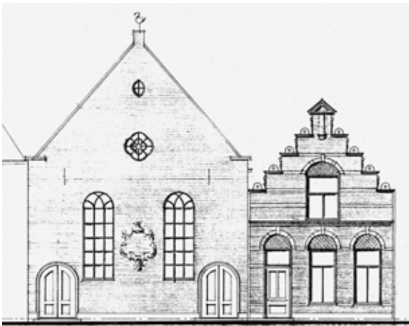
Kerk en kosterij Nieuwe Oosterstraat 28-30 Leeuwarden