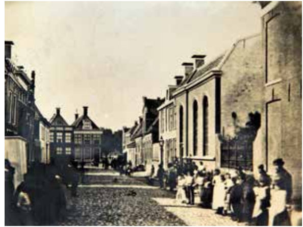
De kerk van 1774, links van de kerk de pastorie. De Wortelhaven is al gedempt

Rond 1878 nam het ledental van de Evangelisch-Lutherse gemeente Harlingen ineens toe door de overkomst van